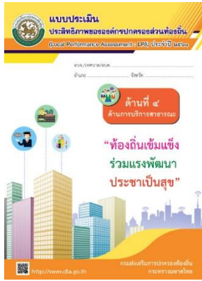
ปีงบประมาณ 2561