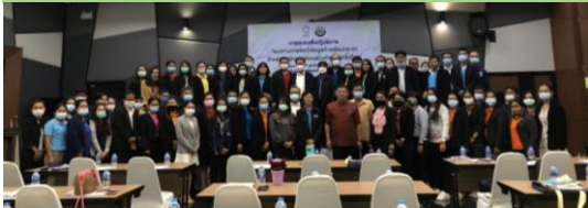
ปีงบประมาณ 2565