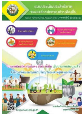
ปีงบประมาณ 2563