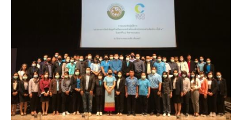
ปีงบประมาณ 2563