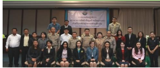
ปีงบประมาณ 2561