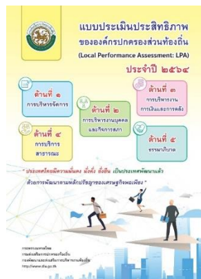
ปีงบประมาณ 2564