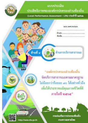
ปีงบประมาณ 2562