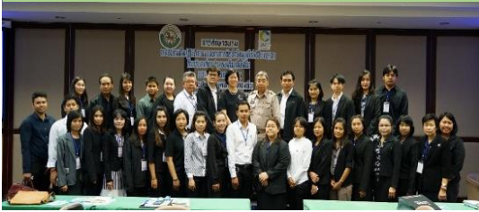
ปีงบประมาณ 2560