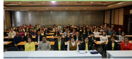
ปีงบประมาณ 2562