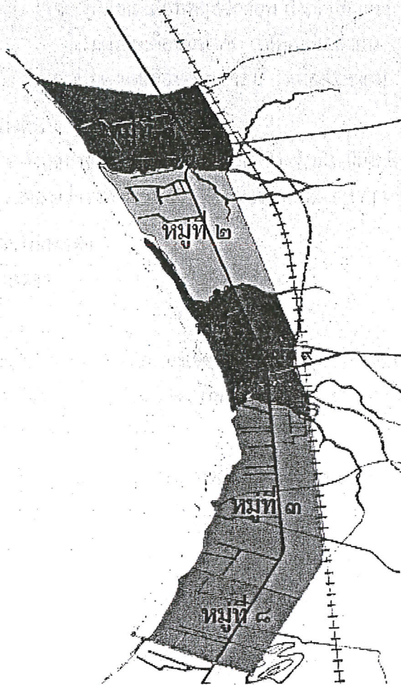
แผนที่ชุมชนเทศบาลตำบลนาจอมเทียน